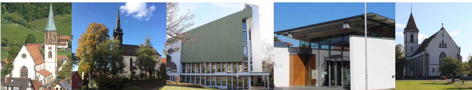
St. Blasius Glottertal

Kirche St. Felix und Regula und Gemeindehaus carl casper haus in Reute Kirchstraße 6, 79276 in Reute