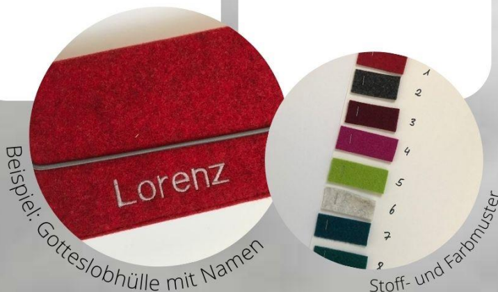
Beispiel: Gotteslobhülle mit Namen